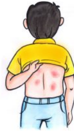
त्वचा पर लाल चकत्ते होना

लापरवाही करने पर कभी कभी डेंगू जानलेवा भी हो सकता है इसलिये डेंगू के लक्षणों को गंभीरता से लें। डेंगू के लक्षण होने पर नज़दीकी स्वास्थ्य केंद्र में जाएं और डॉक्टर की सलाह लें।