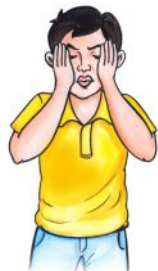
आँखों के पीछे दर्द होना