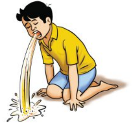
उल्टी होना, पेट दर्द होना