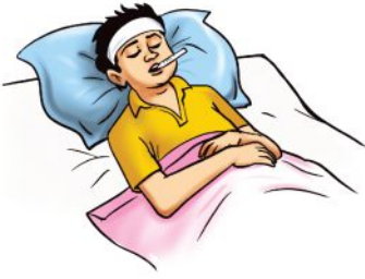
तेज़ बुखार आना