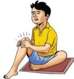
जोड़ों या मांसपेशियों में दर्द होना