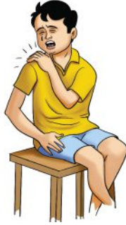
सिर दर्द, बदन दर्द होना